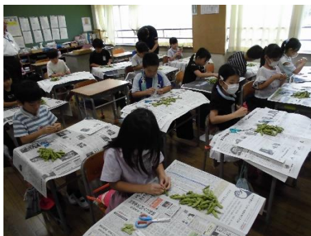
みんなしんけんそのもの