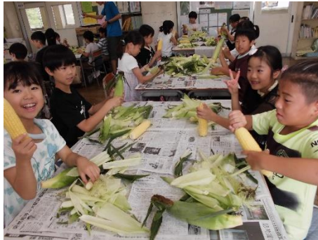
すごいでしょ！むけましたよ