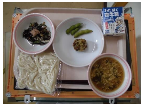
うどんによくあうね