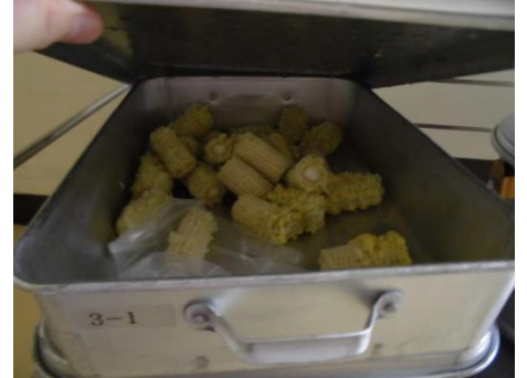
じがんでむくとおいしいな