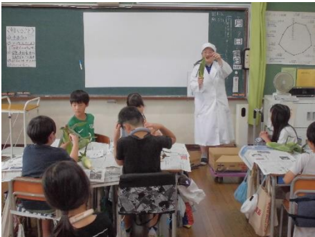
むきかたのコツはこう・・・

むきを実習しました。慣れない作業にかなり手間取っていましたが、頑張ってみてくれました。