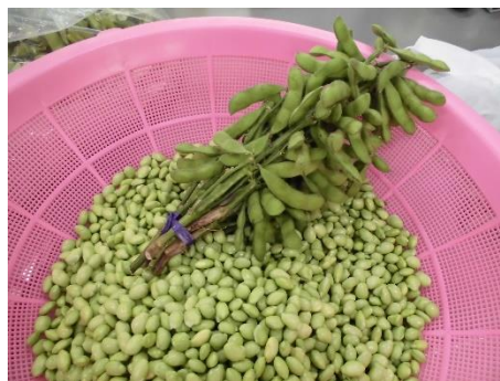
がんばったせいからです